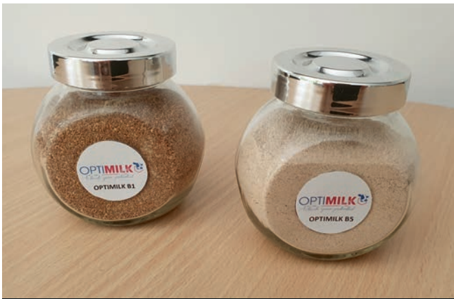
Les poudres Optimilk B1 et Optimilk B5 a destination des fabricants conventionnels et bio.

tales » s'utilise dans l'ensemble des gammes d'aliments. « Nous anticipons l'avenir et voyons le bio comme un référentiel qualité et non comme un marché de niche. Des solutions bio sur ce segment-là, il n'y en a pas beaucoup. Aujourd'hui nous prenons le pari, en étant en accord avec nos idées, avec un positionnement technique et tarifaire, de proposer le produit le plus naturel possible en étant compétitif économiquement : on est dans le jeu ! » Le coût de production est basé sur le conventionnel. « Nous proposons un produit unique, utilisable en agriculture conventionnelle et biologique. Car la réponse est la même. D'ailleurs aujourd'hui la majorité de notre clientèle est conventionnelle. Optimilk est un produit différenciant, de qualité, qui apporte une vraie réponse. »